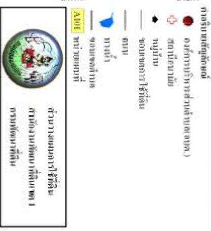
รูปที่ 3-3 แผนผังการใช้ที่ดิน ตำบลจตุร อําเภอน้ําขุ่น จังหวัดนครพนม